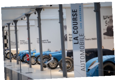
Musée de l'Automobile